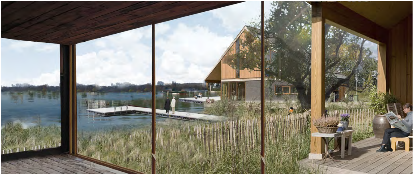
Impression van internationale topmilieu, 'de Watertuinen'