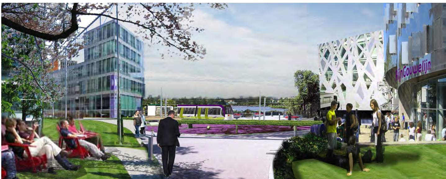
Impressie van de campus op de Locatie Valkenburg