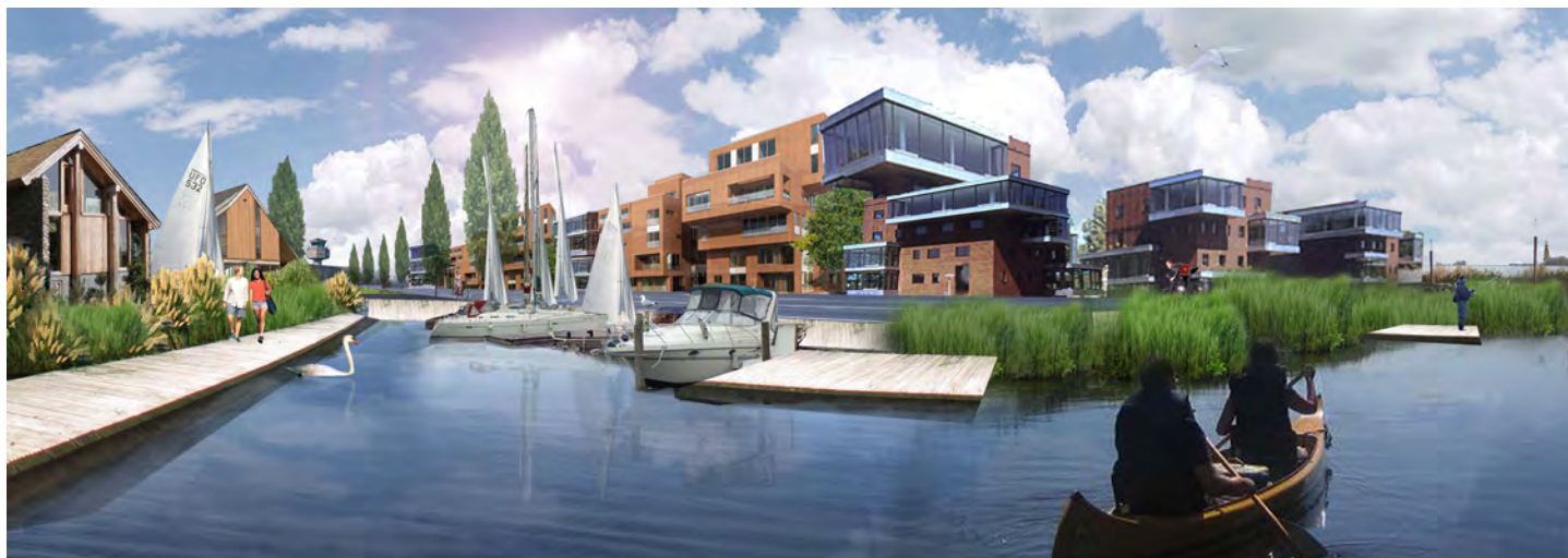
Impression of the harbour

Masterplan voor de integrale ontwikkeling van het voormalige vliegbasis Valkenburg bij Leiden.