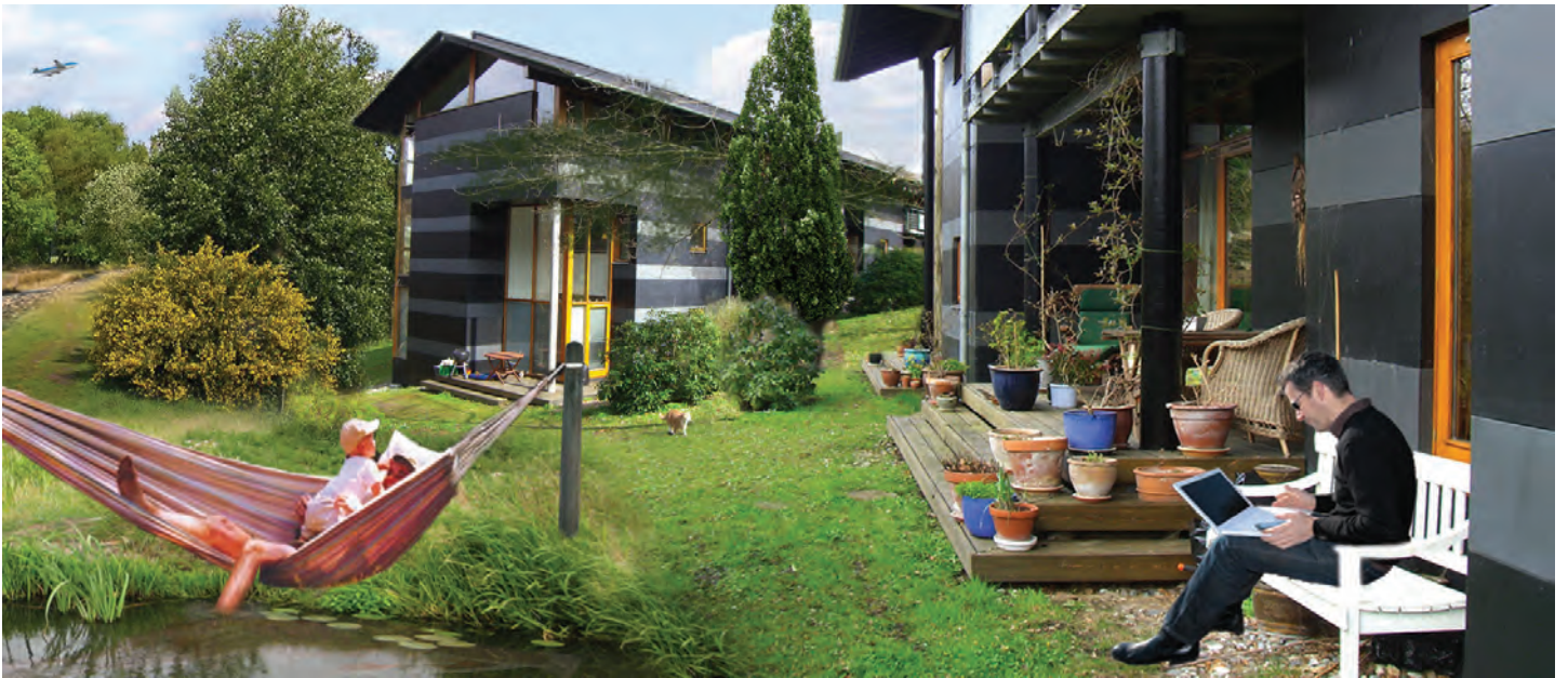
impressie van wonen in een landschap