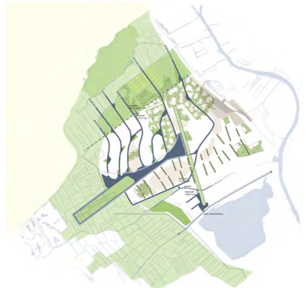
ruimtelijk kader landschap

opdrachtgever: stuurgroep Project Locatie Valkenburg (gemeente Katwijk en RVOB).