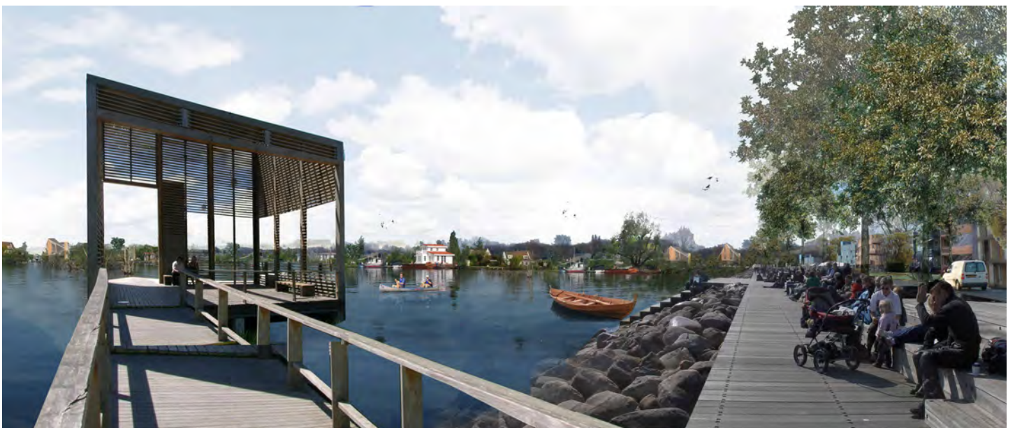
Waterfront aan de plas, het hart van de wijk

Het masterplan biedt ruimte voor duurzame technieken en wordt energieneutraal. De realisatie van het plan zal vele jaren duren. Daarom het landschap wordt omgetoverd als een sterk kader waarin de woonkamer kan 'organisch' groeien.