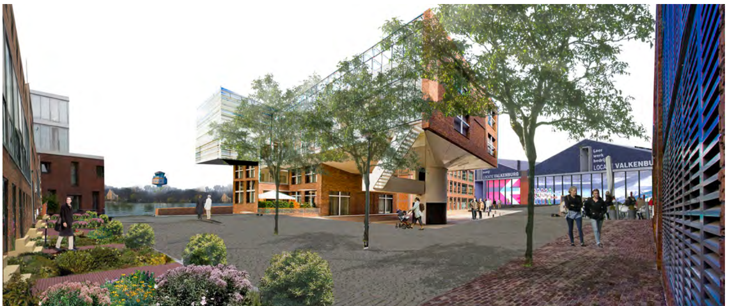
menging van functies in de woonwijk