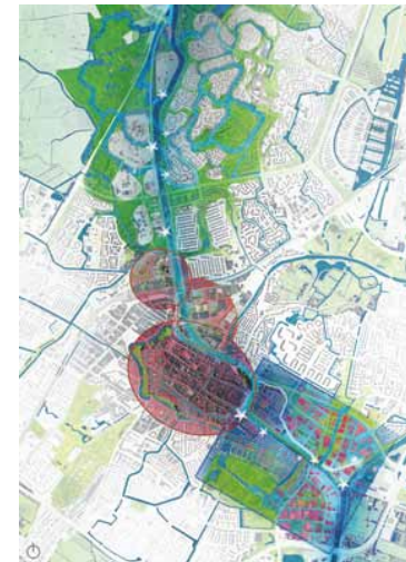
Een 'ontwikkelingsprent' geeft richting aan de verstedelijkingsopgave in de Alkmaarse Kanaalzone, en alle vraagstukken die daarmee samenhangen, zoals mobiliteit en klimaatadaptatie.