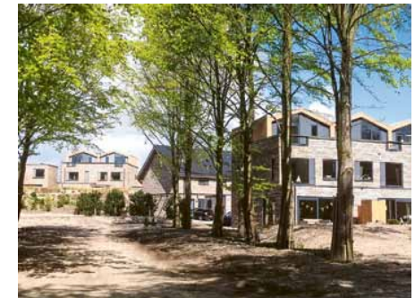
Janssen is al elf jaar betrokken bij het ontwerp en de uitvoering van Almere Duin, een woonlandschap op de grens van land en water.